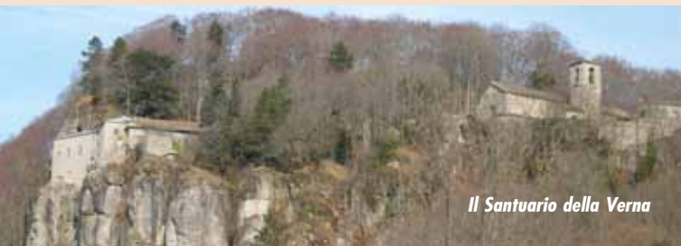
Il Santuario della Verna

E vi saranno momenti di riposo per godere della natura.