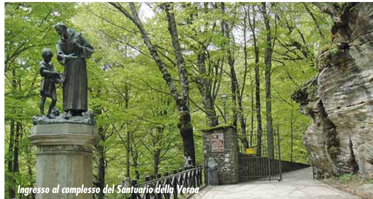
Ingresso al complesso del Santuario della Verna

In treno - dalla stazione di Arezzo prendere il treno della linea "Arezzo-Pratovecchio-Stia". Si può scendere sia a Bibbiena che a Rassina, dove ci sono servizi di autobus per Chiusi della Verna.