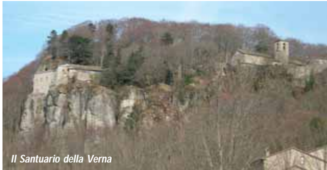
Il Santuario della Verna

Q uest'estate i tre Corsi di formazione e spiritualità che la "Casa del Padre" offre si terranno come di consueto in agosto al Pastor Angelicus a Chiusi La Verna. Sono Corsi aperti a tutti e finalizzati a promuovere il cammino dei Figli di Dio. I temi dei tre Corsi sono fondati sulla Persona di Cristo, il Figlio di Dio, Amore che insegna ed educa, Amore che libera e guarisce, Amore che salva e rigenera . Si può partecipare ad un solo Corso, oppure a due o anche a tre. Essi sono collegati, ma possono essere vissuti anche in modo distinto. Chi vuole riceverne il massimo beneficio dovrebbe frequentarli tutti e tre per cui, per favorire la partecipazione a più Corsi, offriamo formule molto vantaggiose. In ogni Corso sarà presente un Sacerdote che vive la spiritualità del Rinnovamento Carismatico Cattolico.