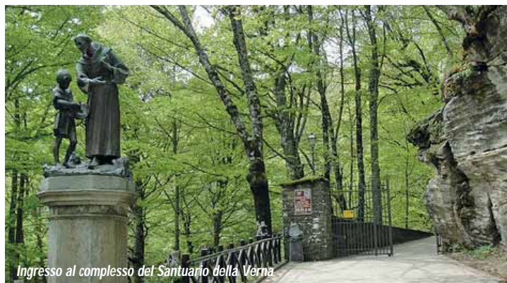
Ingresso al complesso del Santuario della Verna

In treno - dalla stazione di Arezzo prendere il treno della linea "Arezzo-Pratovecchio-Stia". Si può scendere sia a Bibbiena che a Rassina, dove ci sono servizi di autobus per Chiusi della Verna.